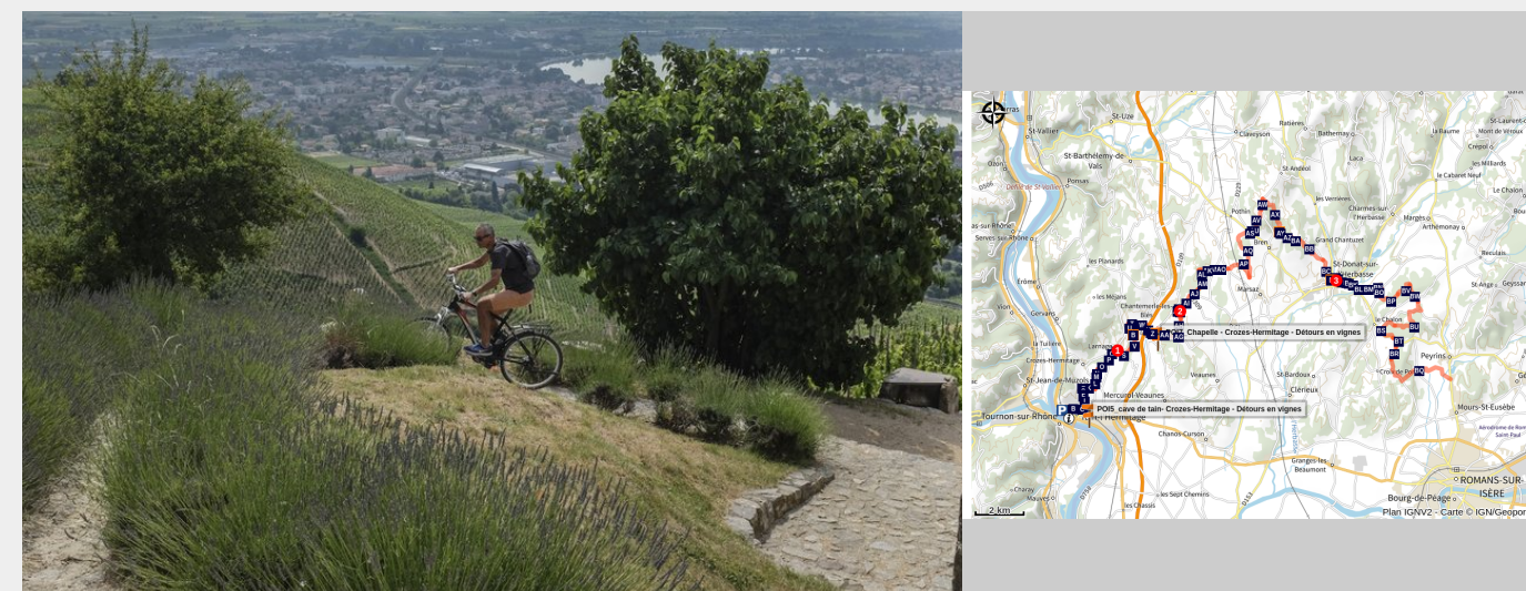
Paysage Drôme des Collines (Jérémy Suyker)

La liaison depuis Tain l'Hermitage se fera en empruntant le parcours VTT FFC N°14 (rouge) sur une distance de 3,5 km pour 90 m D+. Etape vallonnée avec de nombreux passages en sous bois, permettant d'être au frais en période estivale, et bénéficiant d'un revêtement majoritairement sableux. Vous pourrez également traverser de nombreux vergers. Quelques passages techniques dans le bois des Ussiaux.