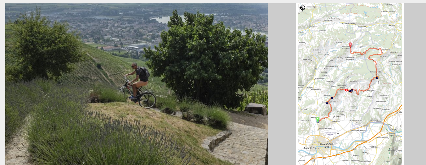
Paysage Drôme des Collines (Jérémy Suyker)

Cette étape bien plus physique que la précédente, présente un dénivelé important et une majorité de sous bois avec quelques passages marécageux, qui se révèle ludique. Le tout est agrémenté de magnifiques points de vue sur le Vercors, ce qui en fait une magnifique étape pour les VTTistes.