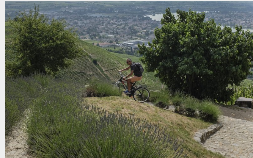
Paysage Drôme des Collines (Ardèche Hermitage Tourisme)