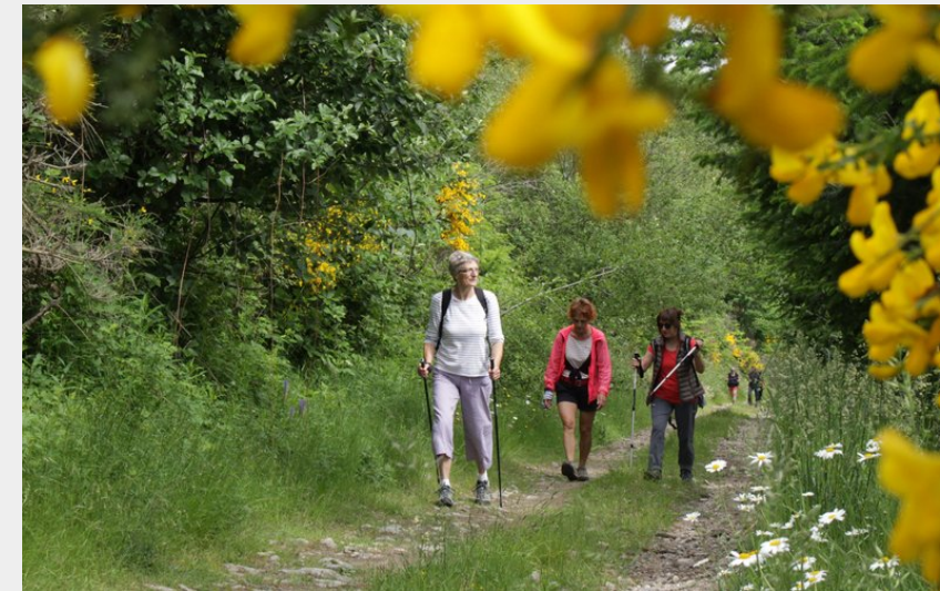
Chemin bucolique