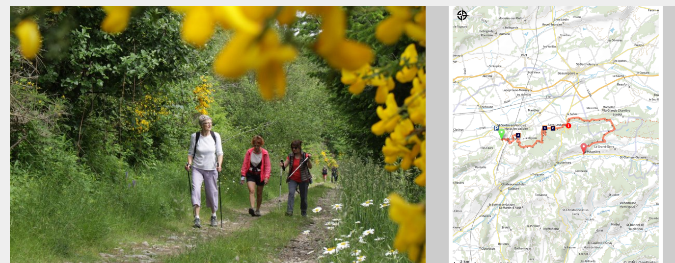
Chemin bucolique (Ardèche Hermitage Tourisme)

Le tracé rejoint le point le plus septentrional de ce tour, s'aventure sur les plateaux de l'Est avant de marquer un virage assumé vers le Sud. La forêt devient plus présente. La descente vers la galeure rejoint la D51, choix de l'étape entre Hauterives et Le Grand Serre.