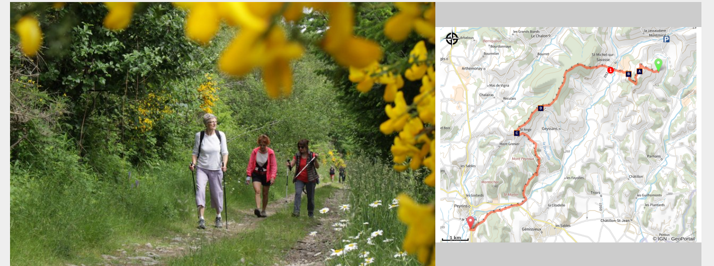
Chemin bucolique

Collines plus escarpées à l'approche du Sud. Partie plus technique que les autres car les chemins sont plus pentus et ravinés. Le vallon de la Joyeuse puis celui du ruisseau du Moucherand sont encaissés. Néanmoins, le paysage est magnifique et les efforts consentis jusqu'à Saint Michel sur Savasse seront récompensés par une jolie et paisible descente jusqu'à Peyrins.