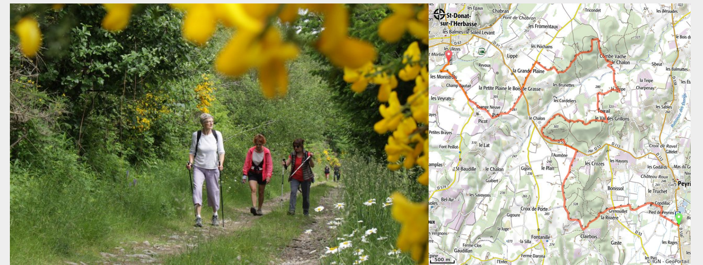
Chemin bucolique

Les collines sont ici bien différentes. La terre aussi change et le "saffre" (des molasses) apporte une érosion importante et des architectures géologiques remarquables. La biodiversité est en rapport, les sites classés Natura 2000 et la végétation a déjà un parfum méridional. De ces terres de sable dans une succession de collines et de vallons, de plaines et de forêts, l'itinéraire rejoint Saint Donat sur l'Herbasse, ville au centre de la Drôme des Collines.