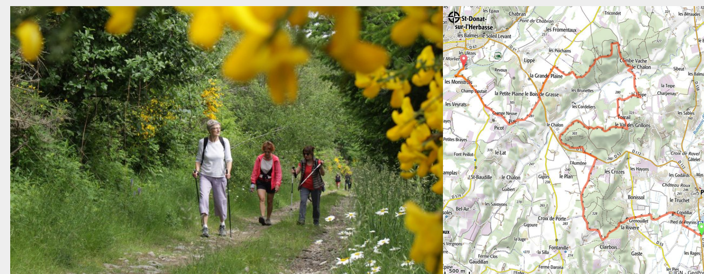
Chemin bucolique (Ardèche Hermitage Tourisme)

Les collines sont ici bien différentes. La terre aussi change et le "saffre" (des molasses) apporte une érosion importante et des architectures géologiques remarquables. La biodiversité est en rapport, les sites classés Natura 2000 et la végétation a déjà un parfum méridional. De ces terres de sable dans une succession de collines et de vallons, de plaines et de forêts, l'itinéraire rejoint Saint Donat sur l'Herbasse, ville au centre de la Drôme des Collines.