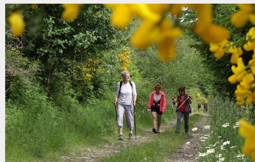
Chemin bucolique