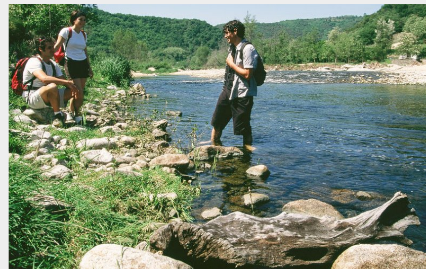
Bords du Doux (Ardèche Hermitage Tourisme)