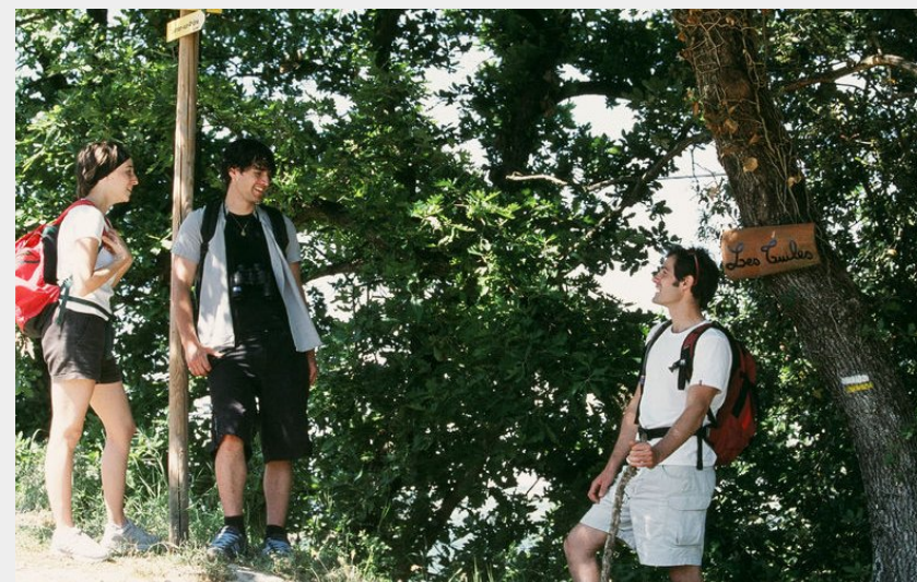
Carrefour le long de la randonnée (Ardèche Hermitage Tourisme)