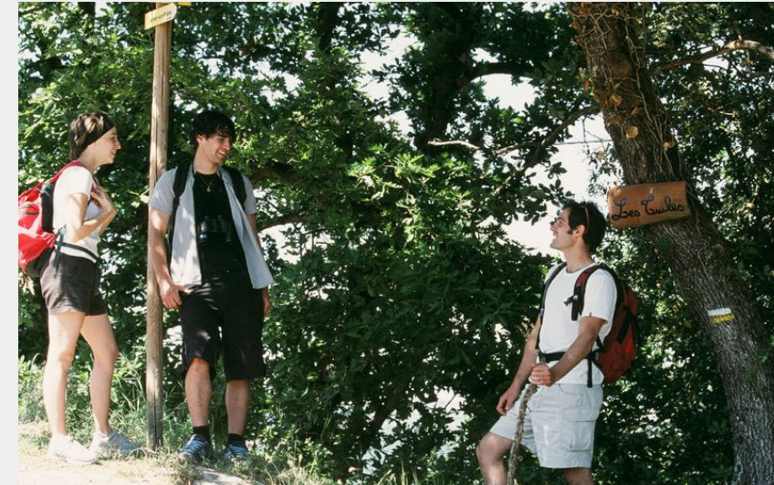
Carrefour le long de la randonnée