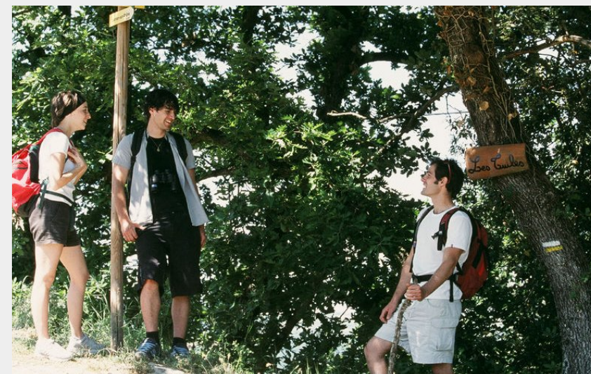
Carrefour le long de la randonnée (Ardèche Hermitage Tourisme)