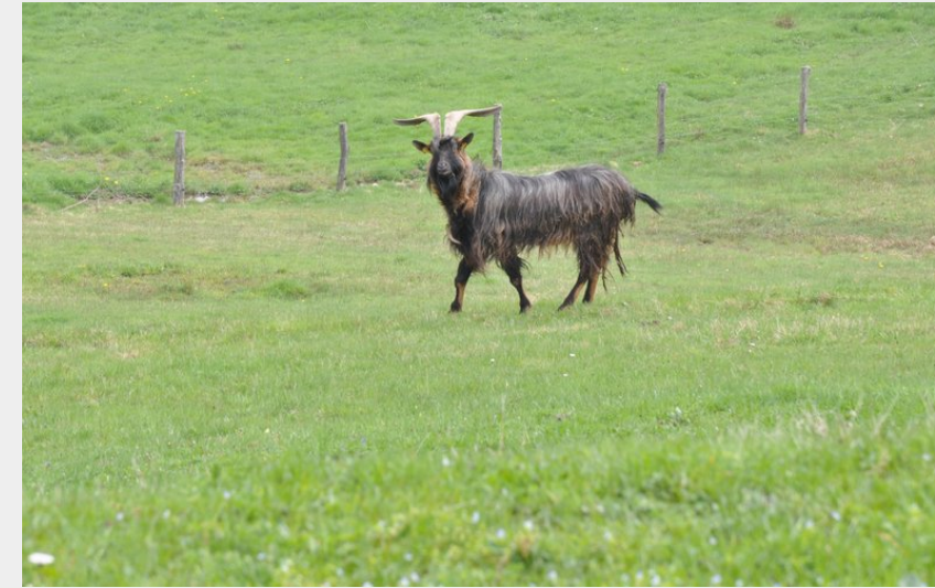
Bouc dans un pré