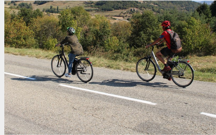
Entre Saint Victor et Saint Félicien (Ardèche Hermitage Tourisme)