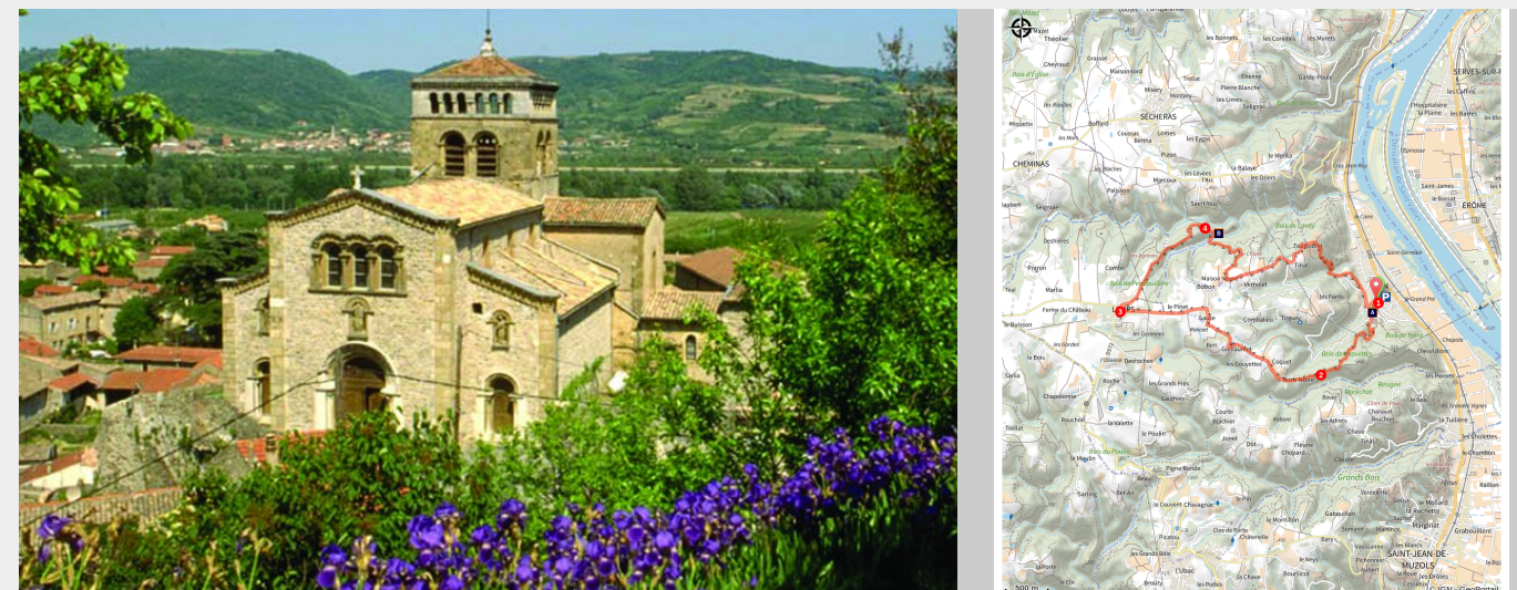
Eglise romane de Vion

Entre vallée du Rhône et plateau, un parcours assez ombragé à la découverte de l'église romane de Vion, du village de Lemps et des ruines du mystérieux château d'Iserand.