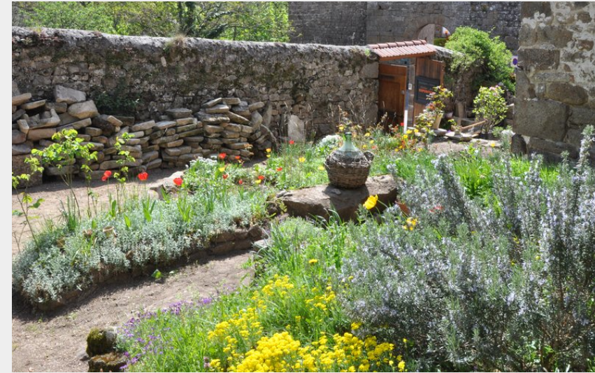
Notre Dame d'Ay