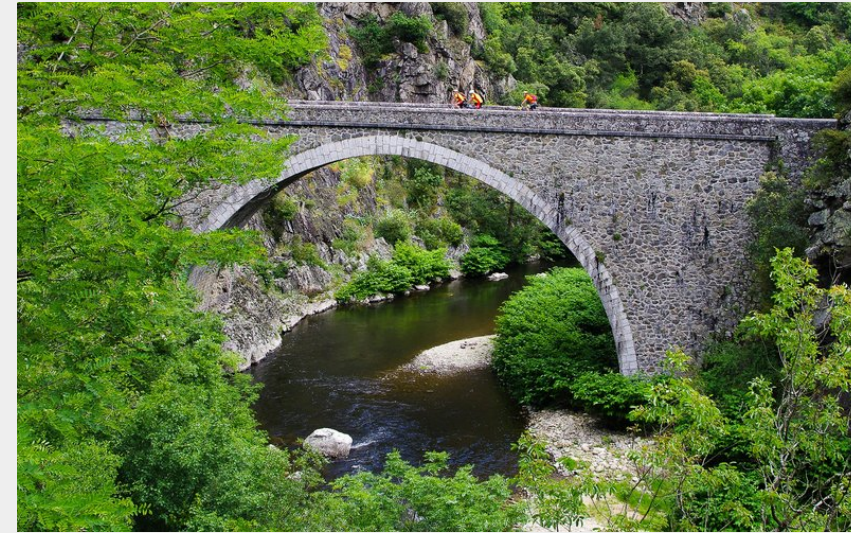
Gorges de la Cance