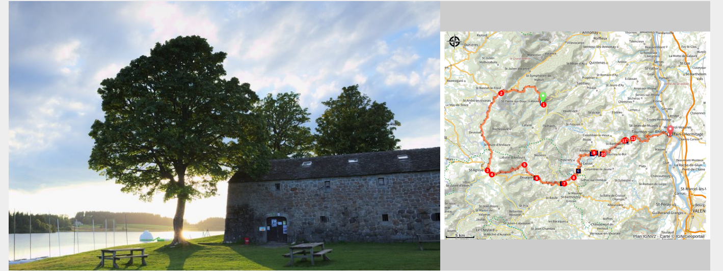
Ferme de Pioulouse, en bordure de lac

Parcours cyclo à profil descendant de Lalouvesc à Tournon passant par le lac de Devesset pour les chaudes journées d'été.