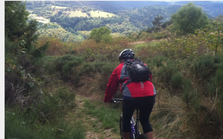
Vue depuis Bobigneux (Ardèche Sports Nature)