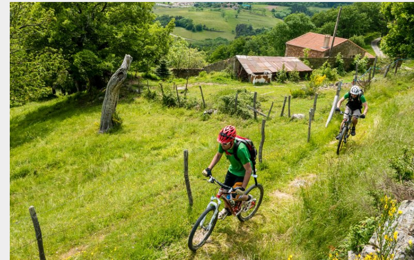
Sentier bucolique (l Voyage - Grégory Rohart)