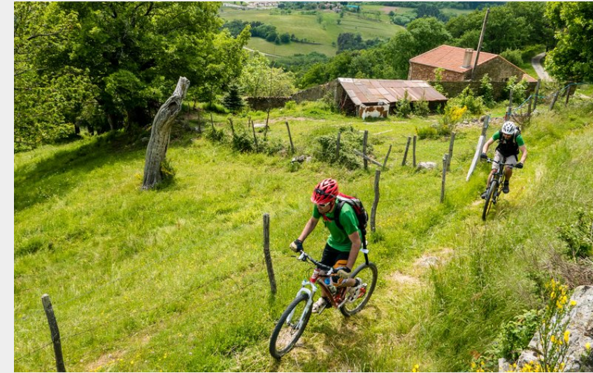
Sentier buccolique (l Voyage - Grégory Rohart)