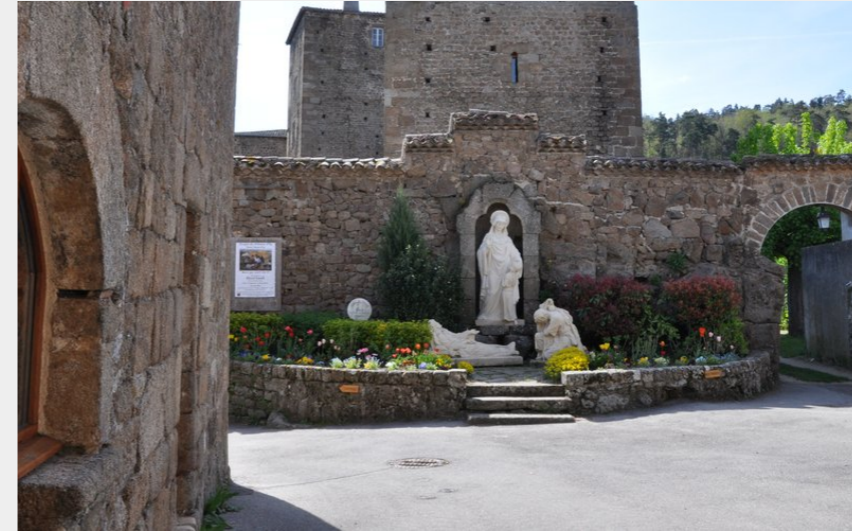
Notre Dame d'Ay (Ardèche Hermitage Tourisme)