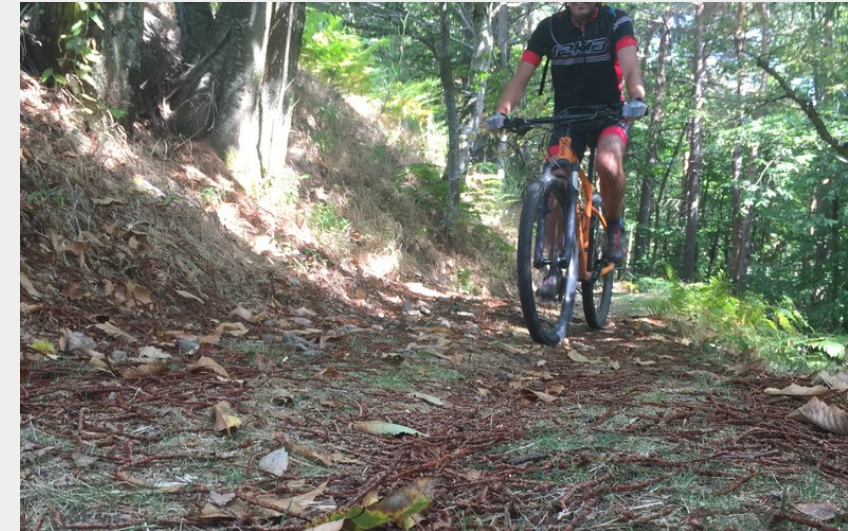
Descente sur le Mathy (Ardèche Hermitage Tourisme)