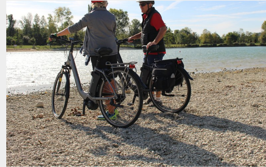
Lac de Champos