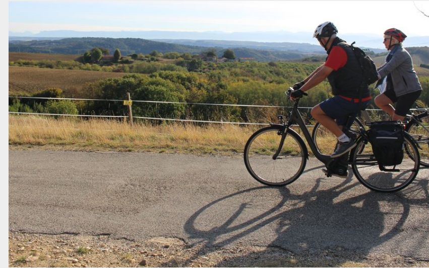
Route en balcon fasse au Vercors