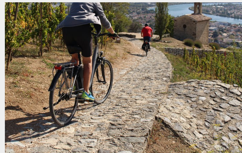
Chapelle de l'Hermitage (Ardèche Hermitage Tourisme)