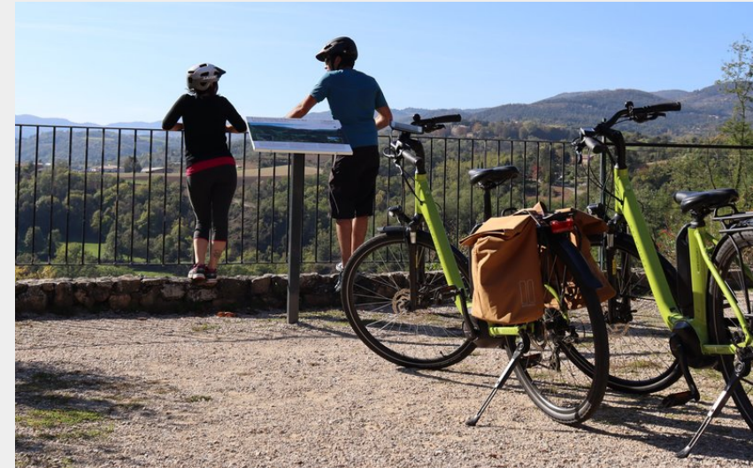
Vue depuis Boucieu le Roi