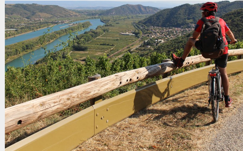
Descente dans les coteaux de Saint Joseph