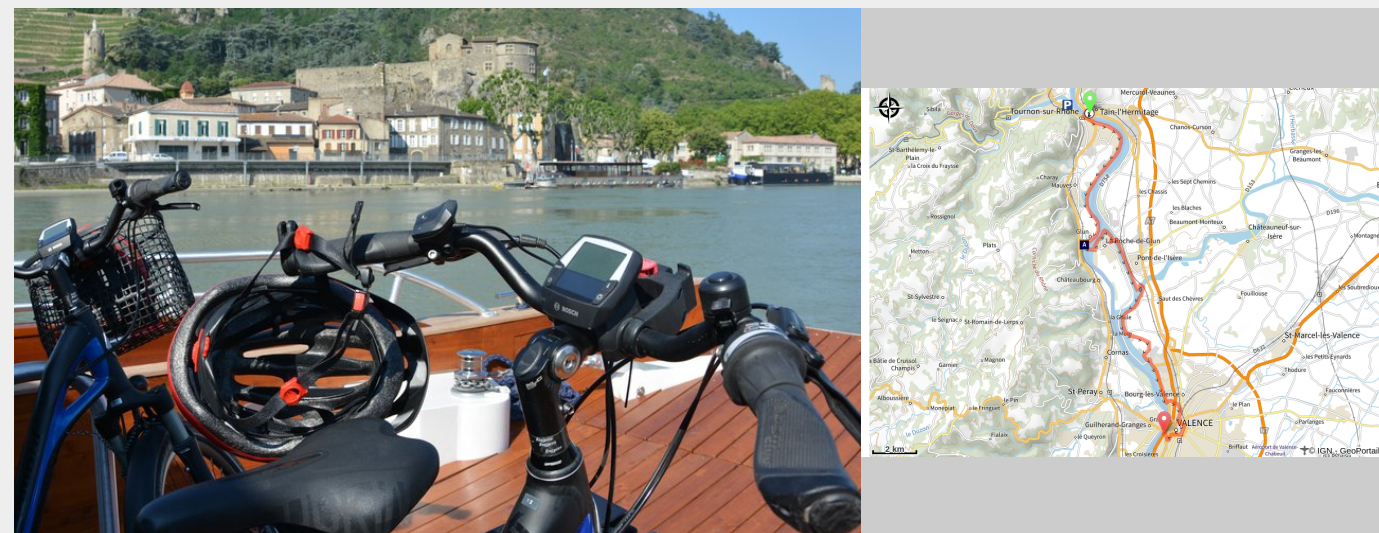
Vélo à bord du bateau des Canotiers (Ardèche Hermitage Tourisme)

Cheminez sur les berges du Rhône sur la voie verte Via Rhôna, itinéraire sécurisé, et profitez du bateau des Canotiers pour remonter avec une croisière et ses explications sur la patrimoine bordant le fleuve.