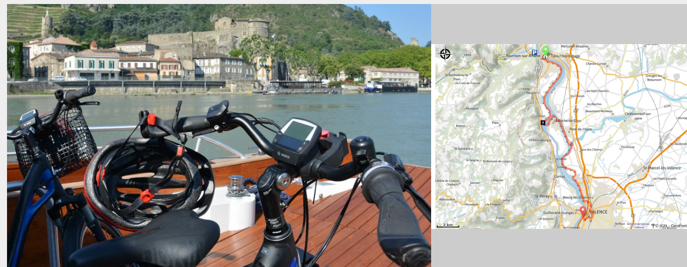
Vélo à bord du bateau des Canotiers

Cheminez sur les berges du Rhône sur la voie verte Via Rhôna, itinéraire sécurisé, et profitez du bateau des Canotiers pour remonter avec une croisière et ses explications sur la patrimoine bordant le fleuve.