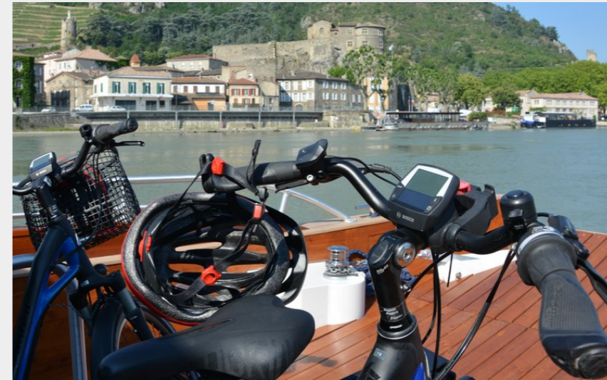
Vélo à bord du bateau des Canotiers (Ardèche Hermitage Tourisme)