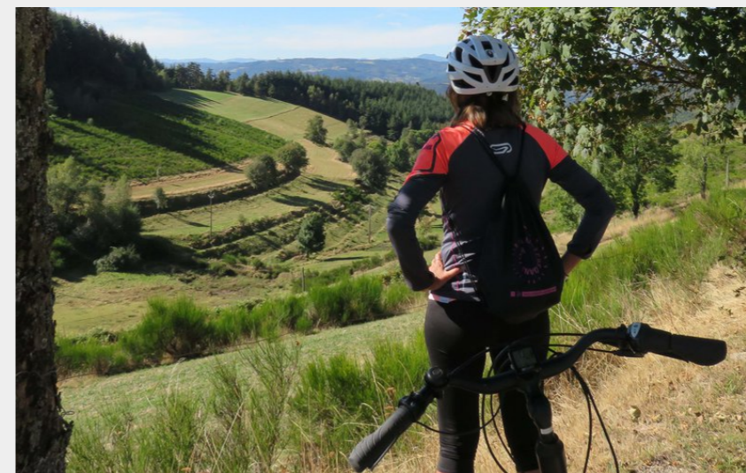
Panorama avant d'arriver sur Lalouvesc (ARG - ADT 07)