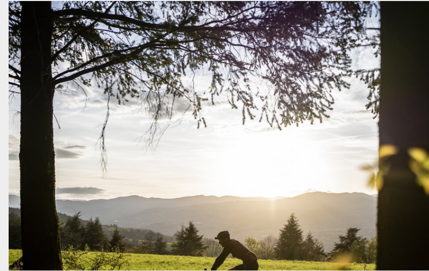
Coucher du soleil gravel