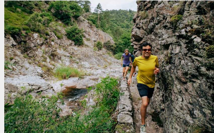
Trail dans les gorges de la Daronne